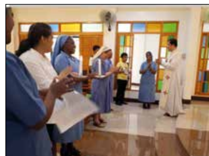
Bendición de la casa de formación.