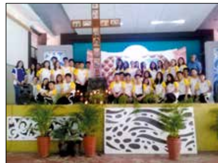
Con niños y jóvenes de catequesis.

Los estudiantes necesitan asesoramiento para conocer y comprender sus emociones, aclarar sus dudas y conflictos.