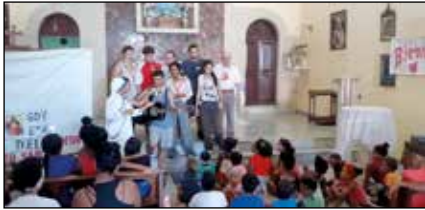
Oración con las Hnas. de Teresa de Calcuta.

ban con una oración en la que se explicaba el lema y el santo del día. Después tenían tres actividades: taller de manualidades, deporte y teatro-música. Antes del almuerzo teníamos una Exposición del Santísimo y algún día Eucaristía. También realizamos alguna excursión. Los valores que cada día tratábamos de infundir fueron: la amistad, la solidaridad, el compartir, el servicio, la vocación, la fortaleza, el respeto, el cuidado de la naturaleza y la oración. Terminamos cogiendo cariño a estos niños que al principio no nos hacían muchos caso, pero que eran muy agradecidos. ¡Cuántas lágrimas en la despedida!