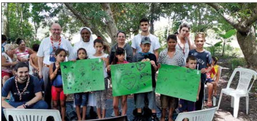
En la Comunidad de Bazarales en Puerto Padre.

En el barrio de Manibón, además de ayudar a las hermanas a distribuir el desayuno, la merienda y el almuerzo, nos dividimos en tres grupos por edades. Había niños desde los 4 a los 13 años. Las actividades de la mañana comenza-