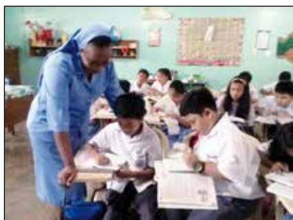
Preparación para los sacramentos

Más que enseñar la religión, como cualquier otra materia, nos esforzamos para