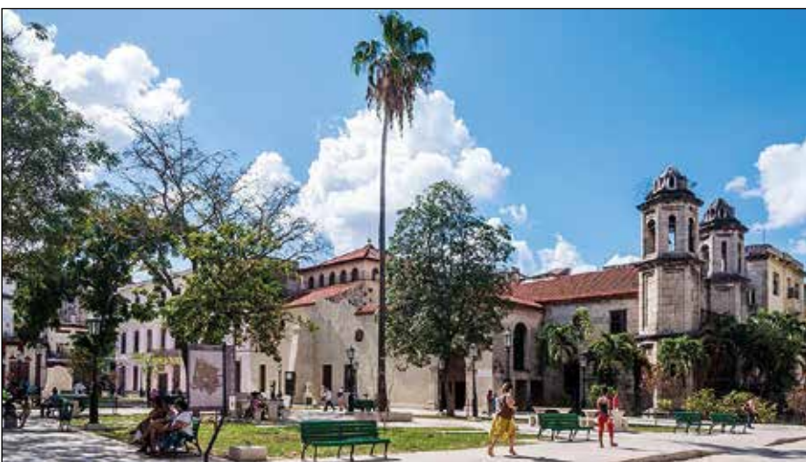
Parroquia Cristo del Buen Viaje.

“Ahora aquí nuestra misión es ayudar a la comunidad eclesial de La Habana, tenemos una oficina de caridad y ayudamos a muchos ancianos comprándole algunas medicinas. El colegio fue convertido en una escuela secundaria básica. Nosotros