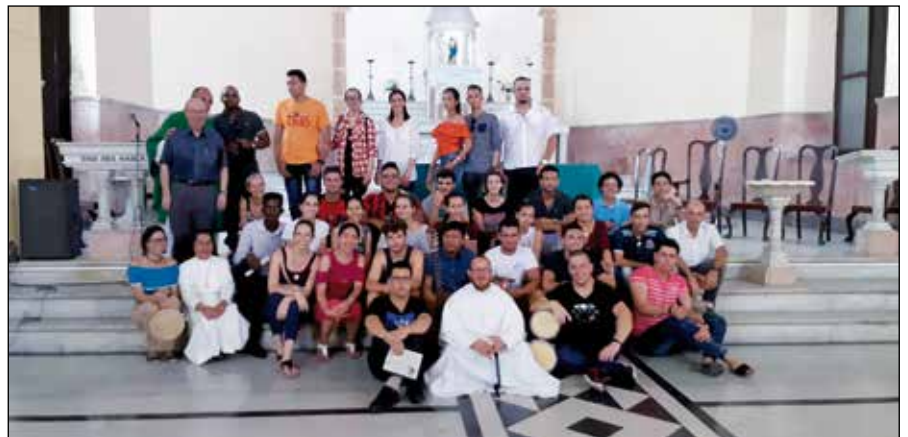
En la Parroquia del Cristo.

Volvimos a España cargados de recuerdos de la gente buena que conocimos. Es un pueblo al que le falta esperanza en