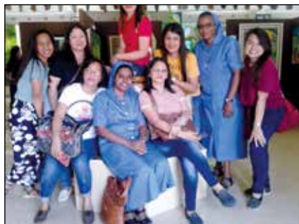
Agustinas, con jóvenes filipinas

También preparamos a nuestros alumnos para los sacramentos de la Primera Comunión, Confirmación y Confesión. Además de la catequesis, ayudamos a estos niños en la preparación para la misa, lecturas, canciones, examen bíblico y otros actos religiosos y lúdicos.