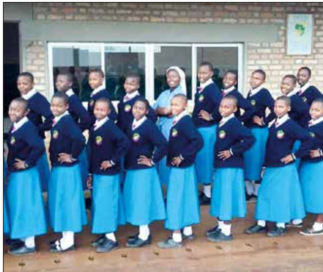
Escuela secundaria de Wino

región sur del país. Desde entonces, y hasta hace un par de años, cada curso han terminado bien preparadas muchas jóvenes ilusionadas con su vocación y profesión de docentes.