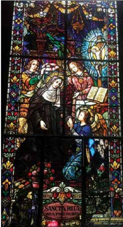
Vidriera de la Iglesia del Cristo del Buen Viaje.

habitamos la parte superior del edificio que es el convento. En el despacho parroquial “tenemos los archivos de más de 300 años