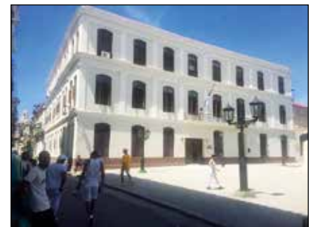
Colegio recién restaurado.

Contamos actualmente con tres parroquias y seis sacerdotes. En dos de nuestras parroquias hay dos comunidades de religiosas misioneras. En estas parroquias,