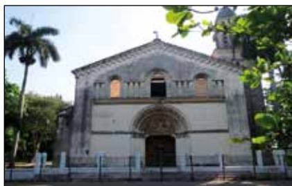
Iglesia de la Universidad de Sto. Tomás de Villanueva.

En la diócesis de Ciego de Ávila, en concreto en Chambas, se sitúa la parroquia de la Inmaculada Concepción, donde la comunidad agustiniana, Beato López Piteira, además de atender dicha parroquia, tiene a su cargo varias capillas o comunidades de misión, a la vez que un dispensario de medicinas que se mantiene gracias a los envíos que se hacen desde España. Una gran y sa-