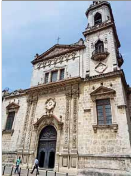
Iglesia del Convento de S. Agustín.

La comunidad de La Habana donde se atiende a la parroquia del Santo Cristo del