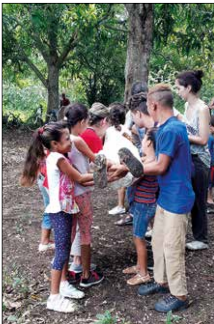
Pausa de juego

En uno de los fines de semana participamos en el Encuentro de Jóvenes de las parroquias que los agustinos tienen en Cuba: Chambas, Puerto Padre y la