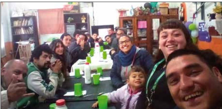
Reunión de jóvenes en el Hogar de Cristo

El Hogar de Cristo es una familia, formada por rostros e historias concretas, no es un mero dispositivo terapéutico. En el Hogar, cada persona que llega es