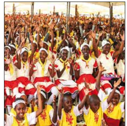
Celebración eucarística en Nairobi, antes de la pandemia.

El objetivo del proyecto es mejorar el cuidado diario, la alimentación, las sesiones de terapia, el aprendizaje y la participación de los niños con discapacidades a medida que crecen. La visión del Centro es ser la organización líder en la