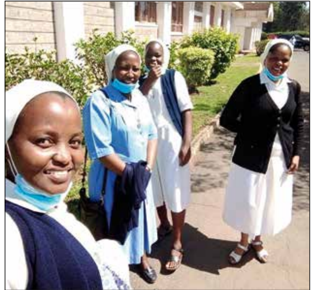
Hnas. Agustinas Misioneras de Nairobi.

En el Centro Songa Mbele na Masomo hay un 90% de niños discapacitados y un 10% de niños que abandonaron la escuela o que nunca han ido a la escuela aun teniendo la edad escolar.