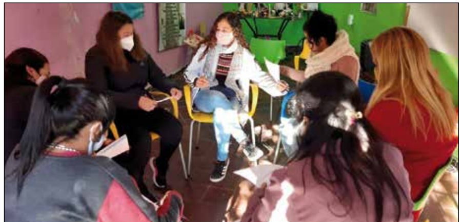
Encuentro de cooperantes con personas necesitadas, en el Hogar de Cristo

que los chicos y chicas del Hogar iban haciendo dentro de su comunidad parroquial. Retiros, campamentos, misiones, recorridas por las calles con el mate cocido y el pan para la gente que vive en situación de calle, preparar la comida en los comedores para los vecinos del barrio