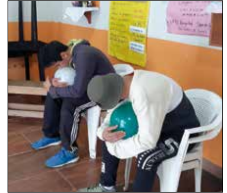
Momento de meditación

El Hogar de Cristo es un modo de ser Iglesia, que se arraiga en el Evangelio y abraza la propuesta del Papa Francisco de “Recibir la vida como viene”. El Hogar se estructura físicamente en diferentes espacios y dispositivos conocidos como “Centros Barriales” distribuidos en 19 provincias de nuestro país desde hace ya 13 años. Estos Centros están ubicados en barrios populares / villas de emergencia y tienen como finalidad “dar respuesta integral a situaciones