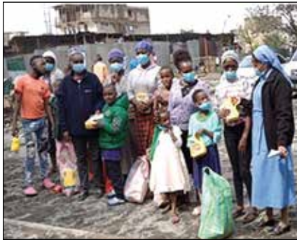
Padres de niños discapacitados recibiendo alimentos.

mejora de la provisión de habilidades y conocimientos relevantes para los niños que viven con discapacidades y los niños vulnerables en Kenia. Su misión es reducir el analfabetismo, la dependencia y mejorar la atención médica de los niños. Los valores y tareas fundamentales del centro son: servicio, trabajo en equipo, compromiso, amor y aprecio por los niños, integridad y responsabilidad.