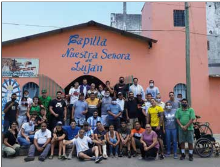
Colaboradores del Hogar delante de la Capilla de Ntra. Sra. de Luján

sostenida, amigable, llena de paciencia y compasión. Para el Hogar cada persona es sagrada y ninguna sobra. Los Centros barriales esperan al que llega con la mesa puesta, como cuando alguien espera a un familiar, con la ducha calentita para el que pasó la noche en la calle. Se prepara el mate y mientras van charlando las historias se van entrelazando. El Hogar de Cristo es un “hospital de campaña”, que siempre sale a buscar al que está herido, que abraza y acompaña sin juzgar, que no se queda esperando. Para el Hogar, no hay condenados o condenadas, para el Hogar hay un “otro” que siente, que sufre, que acierta y se equivoca. Un “otro” que nunca se da por perdido. El Hogar de Cristo se caracteriza por brindar una cercanía samaritana, que valora los gestos pequeños que día a día humanizan la vida del otro.