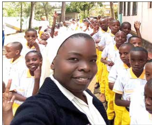
Niños de la Santa Infancia.