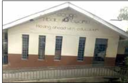
Centro infantil Songa Mbele na Masomo.

El Centro es el único de su tipo en Mukuru Slum y consta de dos secciones: La Unidad Especial para Niños con Discapacidad . Los niños de esta unidad tienen problemas especiales como autismo, parálisis cerebral, trastorno hiperactivo, discapacidad auditiva, trastorno de convulsiones, epilepsia, retraso del habla y dificultades de aprendizaje. Se les apoya con educación básica, servicios de guardería, higiene, sesiones de terapia, medicación y educación.