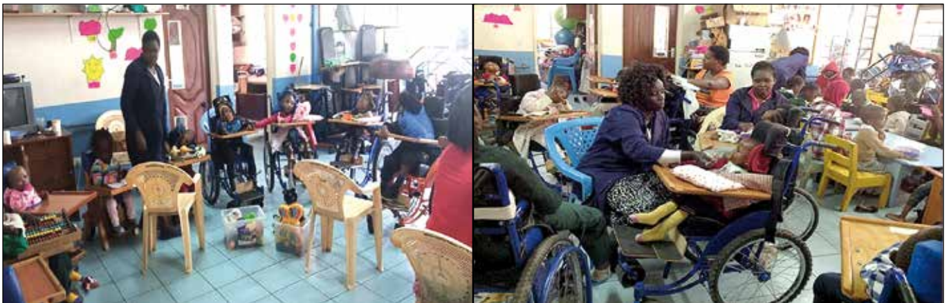
Algunos de los niños discapacitados con sus profesores de atención especial.