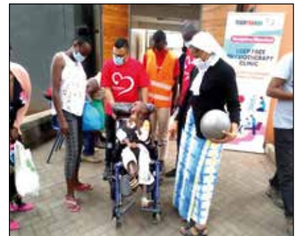
Atendiendo a uno de los discapacitados

la pandemia covid-19. Las donaciones hacen sonreír a estos niños vulnerables y crean un futuro brillante para ellos. Desde el centro de Songa Mbele, los niños deben continuar con su educación en Instituciones Especiales. El Centro continúa ayudándoles de su educación hasta que puedan valer por sí mismos. Es una misión gratificante y desafiante que nos ha dado otra forma de ver la vida y a las personas.