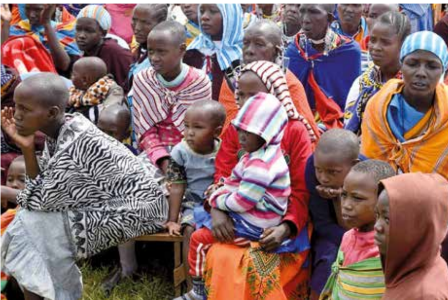
Jóvenes maasai de Enduimet.