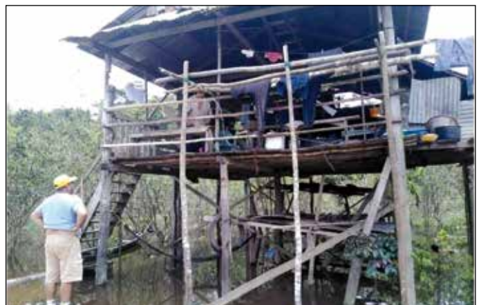
Visitando una familia necesitada.