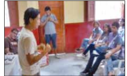
Testimonio de un drogadicto a los alumnos del colegio.

Siento que todo esto era bueno para Dios, ante los ojos de nuestro Señor era una noble tarea que hacíamos sin darnos