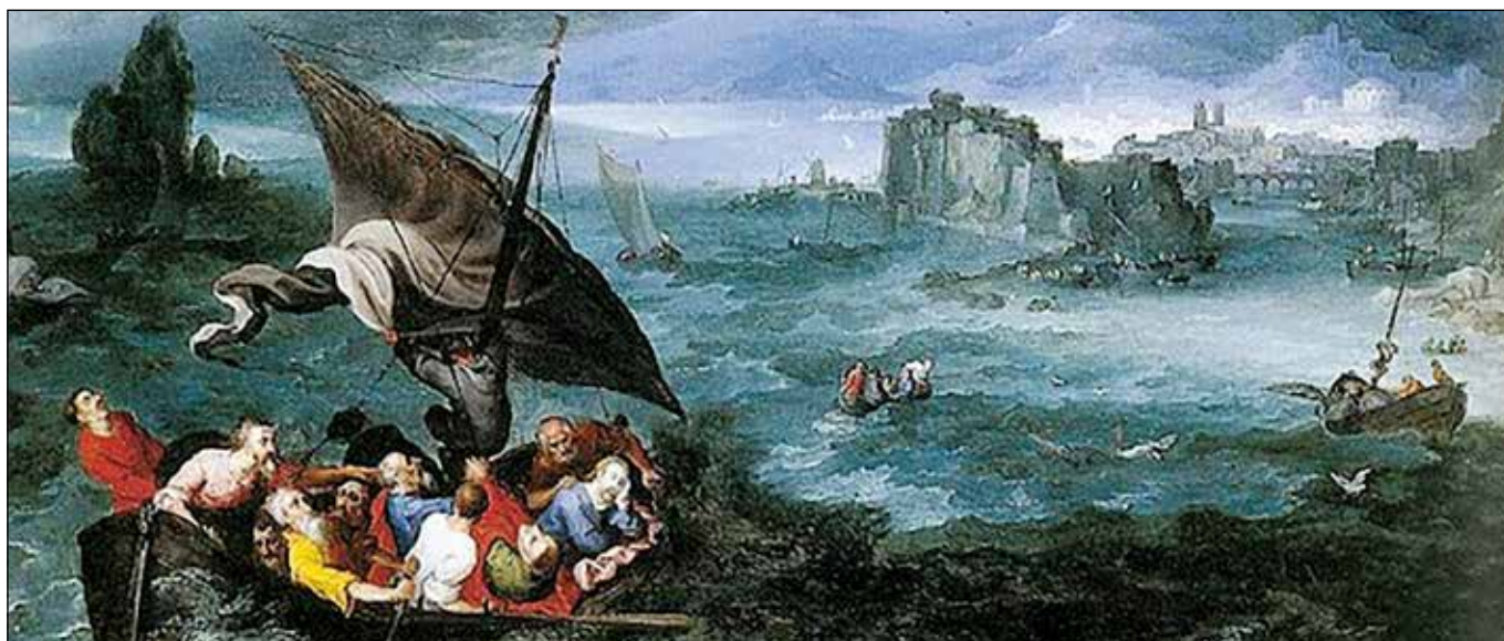
Cristo en la tormenta del mar de Galilea. Pintura de Peter Bruegel el Joven de 1596. Museo Thyssen, Madrid.