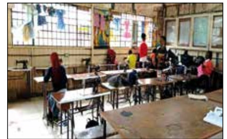
Taller de costura en Mukuru.

La pobreza es el principal reto debido a la falta de trabajo, enfermedades, educación, etc. El Centro Rubén de los Hermanos Cristianos ha devuelto la alegría a muchos que están sufriendo. Los servicios ofrecidos por el personal calificado tienen un gran impacto en la vida de la comunidad, a partir de la escuela primaria donde los jóvenes obtienen su