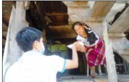
Repartiendo comida a familias pobres.

Hoy en día nuestro mayor apoyo son los jóvenes voluntarios de nuestra parro-