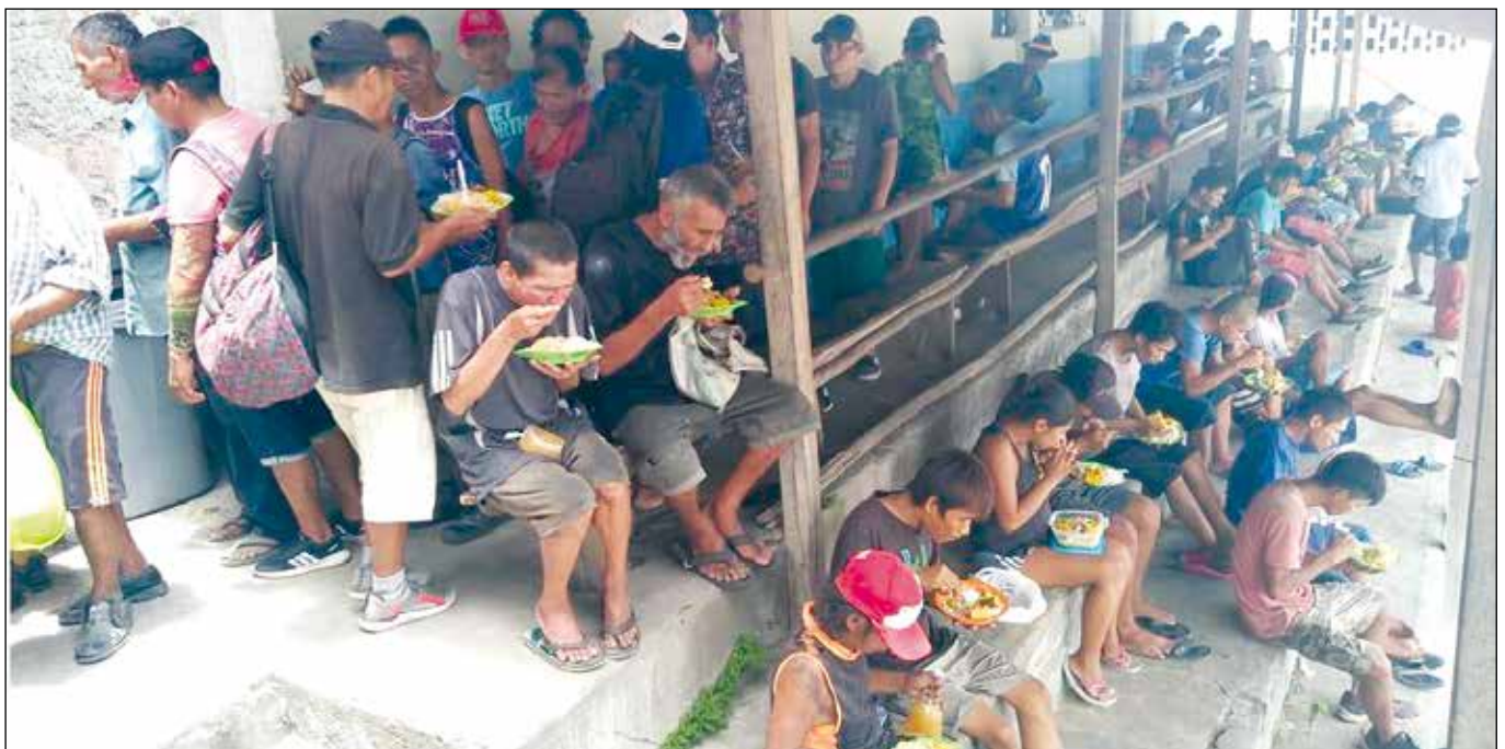
Distribución de alimentos a los necesitados.

Pero este trabajo no fue fácil, puesto que por mucho tiempo recibimos los sinsabores de las personas que no entendían o que no comprendían nuestra labor. Recibimos insultos, agresiones, persecuciones, que muy bien hubiéramos dejado todo por nuestra comodidad, pero la fuerza de Dios prevalecía cada día más ya que en este caminar se fueron sumando las personas y los alimentos que llegaban de la nada solo con la gracia de nuestro Señor y también hubo gente humilde que desde su pobreza contribuían con esta noble acción. Es así que en el camino atendíamos con almuerzo los días lunes, miércoles, viernes y sábado. Recibimos