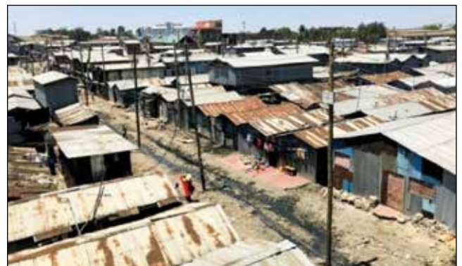
Suburbio de Mukuru.

un solo maestro para una población de 70 a 100 niños por clase. Debido a la falta de instalaciones y recursos, a las familias les supone un gran reto el mantener a sus hijos en las escuelas debido a la falta de recursos básicos escolares como libros, material de escritura, uniformes, etc. por lo que