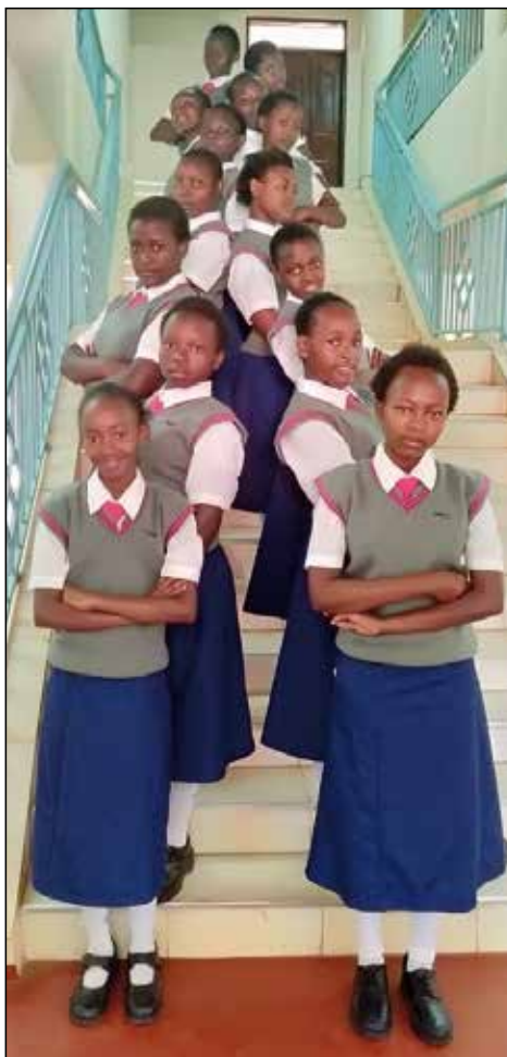
Alumnas de la escuela Sta. Rita, Kenia.

Asimismo, a las Agustinas Misioneras, Provincia de Santa Mónica, se les ha aprobado la ayuda para el proyecto "Sala de informática", que quieren instalar en la Escuela de Secundaria Sta. Rita, Mariani - Tharaka Nithi (Kenia). Como indican en su petición, "las hermanas agustinas tenemos dentro de nuestro carisma, la promoción y educación de la niñez y juventud para que se formen y sean agentes que vayan transformando la sociedad en otra más justa y humana"