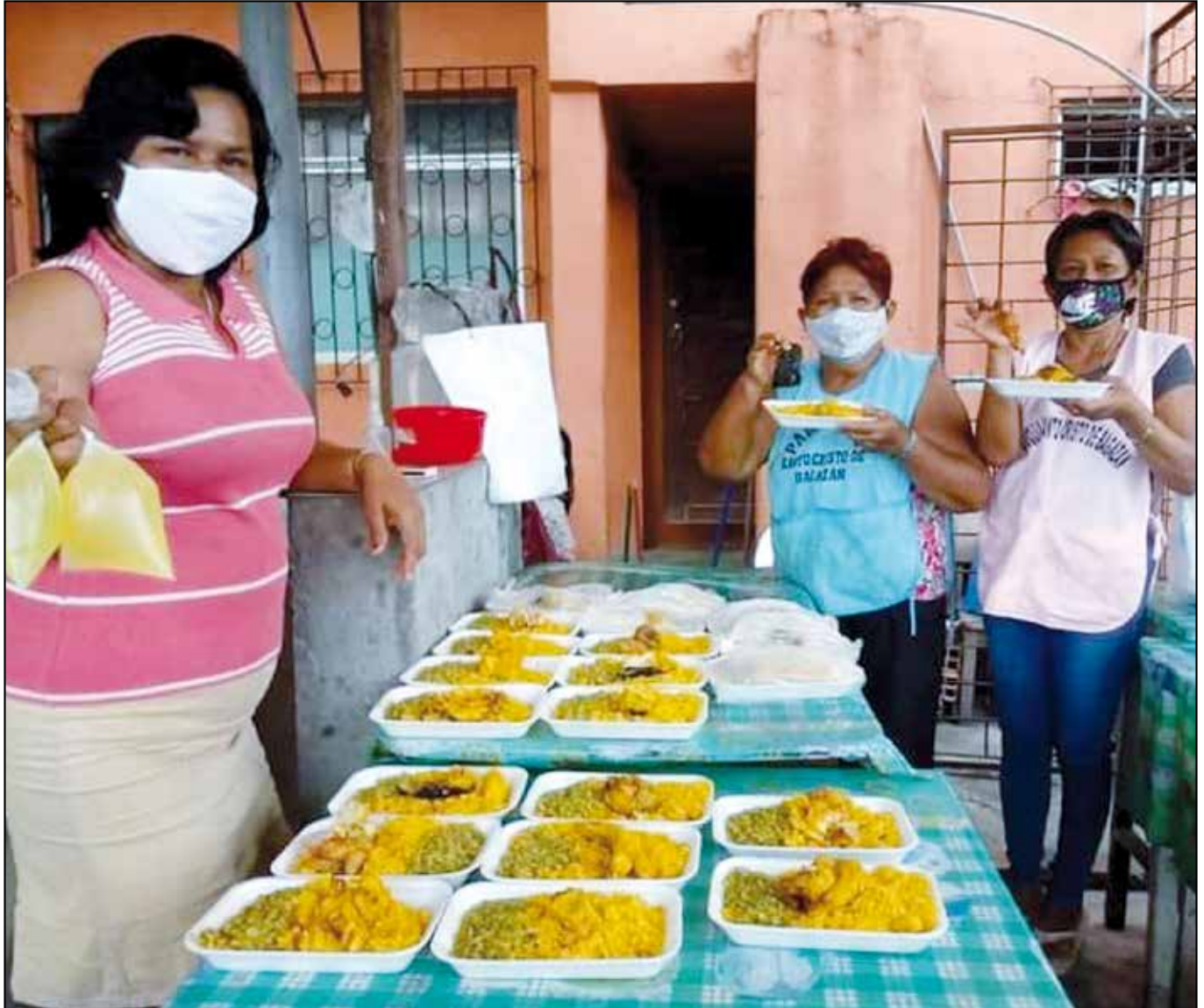
Colaboradoras de la Parroquia del Sto. Cristo de Bagazán, Iquitos, (Perú) distribuyendo comida a los necesitados.