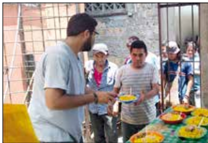
Distribución de alimentos.