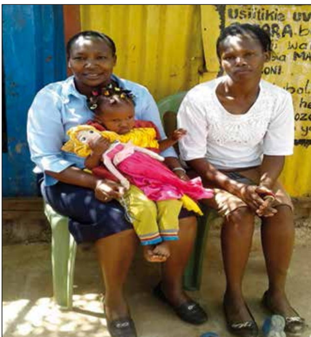
Mujeres en el Centro de Salud.