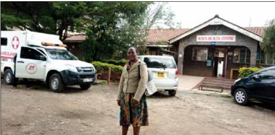
Centro Ruben en Mukuru.