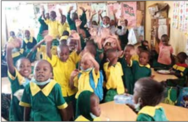
Niños de Mukuru