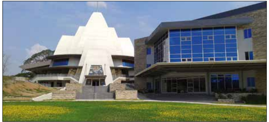
Iglesia y Colegio S. Agustín de Bulacán

El campus, rodeado de exuberante vegetación y árboles, es muy amplio y permitirá nuevos proyectos en el futuro.