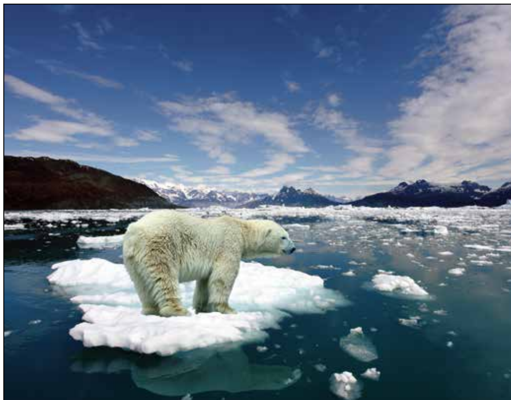
Deshielo en el Ártico.

Mensaje para la Jornada Mundial de Oración por el cuidado de la Creación