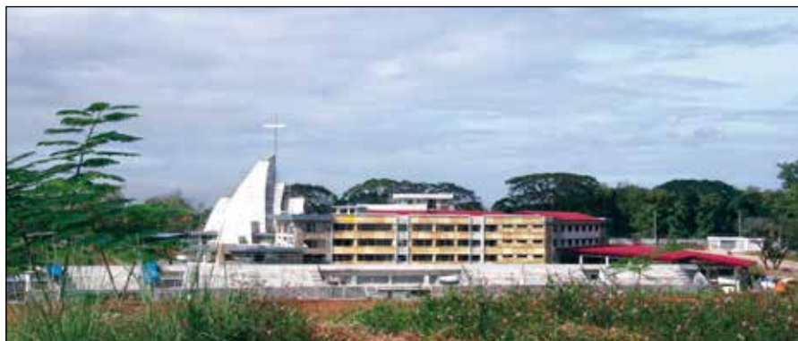
El Colegio S. Agustín de Bulacán, en construcción, en 2014.

Un día típico de Colegio comienza con una misa a las 7 de la mañana en la Capilla muy grande con capacidad para mil personas, con una puerta principal réplica de la de San Agustín de Intramuros y un Cristo Resucitado de grandes dimensiones (quizá 10 metros) que preside el altar. Después se van para las aulas. Hay recreo a las diez para tomar la merienda. Siguen con las clases hasta las 12 para la comida. Se reúnen a la una hasta las tres y media de la tarde. En algunos días de la semana hay deportes. Los alumnos, las profesoras, los frailes que van de hábito, y todos los que tra-