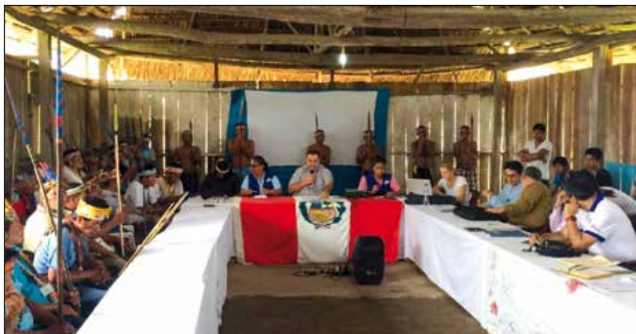
Mesa de diálogo en Saramurillo, 12-10-2016.