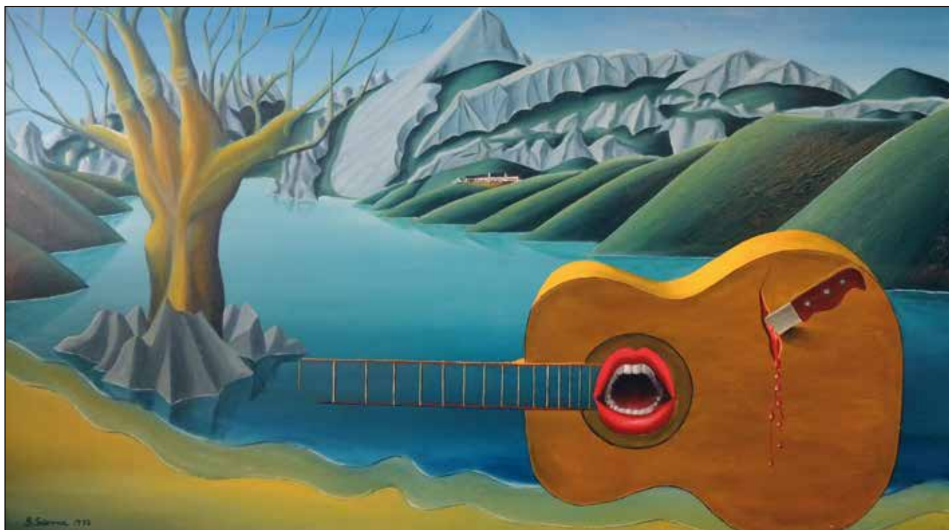
“Riaño: El grito de un pueblo”: Óleo de Blas Sierra. Realizado en 1975, en protesta contra el embalse de Riaño.