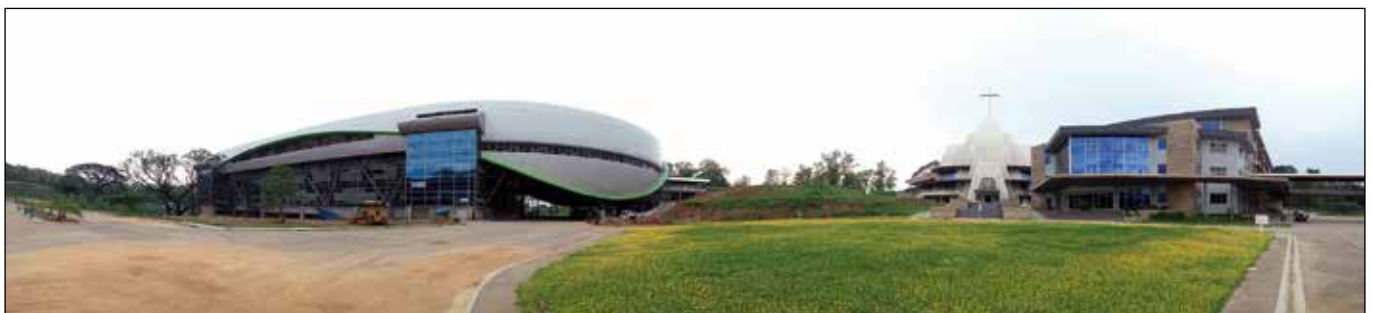
Vista panorámica del Polideportivo, Iglesia y Colegio S. Agustín