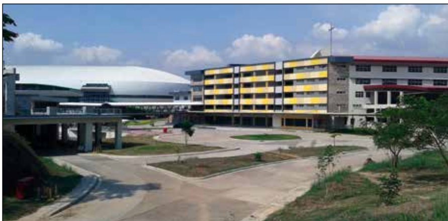
Vista del Polideportivo y Colegio S. Agustín de Bulacán en 2016.

La comunidad de 4 frailes del Colegio ayudan en los ministerios y actos litúrgicos en las varias parroquias de SJDM