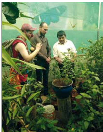
Mariposario de la Sda. Familia

El último de los colegios parroquiales de la ciudad de Iquitos es el “Virgen de