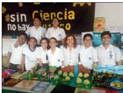
Directora y alumnos de Virgen de Loreto