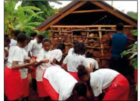
Alumnas de Sta. Mónica construyendo una casa en Mbeere Las alumnas se preguntaban cómo podía ser posible.

Mientras tanto, otro grupo preparó una comida para el almuerzo de esta familia. Mientras se preparaban, conversaron con la madre de familia y se enteraron de que esta familia se había quedado sin comida durante varios días.