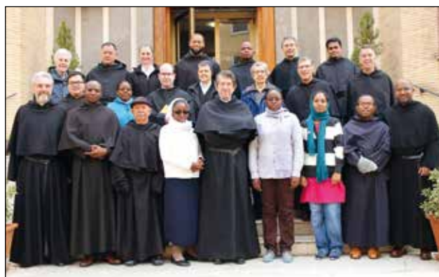
Participantes en el Curso de Espiritualidad con el P. General