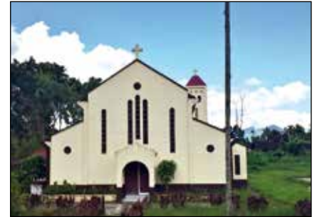
Iglesia de S. Pedro de la misión de Lubuagan

Desde su llegada – hace tres años-, los agustinos han fundado en total 15 pequeñas comunidades en toda la ciudad. Sin embargo, hasta el presente, no todas estas 15 “mission stations” tienen su propia capilla. Por eso, durante las misas y otras celebraciones litúrgicas, éstas tienen lugar en casas privadas o en cualquier espacio libre de la zona. Teniendo en cuenta la gran cantidad de comunidades de misión diseminadas