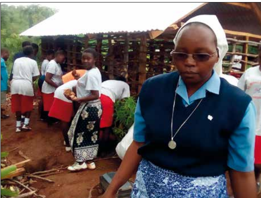
Agustina Misionera y alumnas construyendo una casa