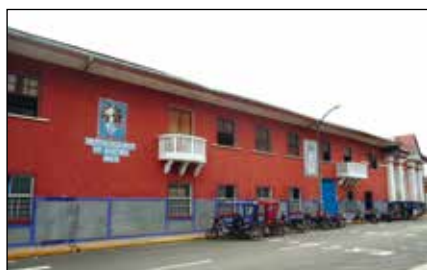
Colegio de Nauta